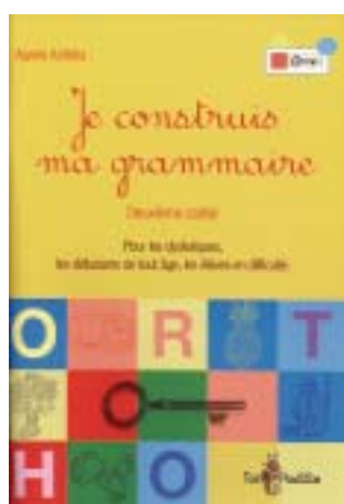
Deuxième cahier : CE2