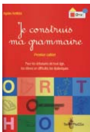
Premier cahier : CE1

Trois manuels abordant la grammaire de façon progressive afin d'apprendre ou de réapprendre les règles de base.