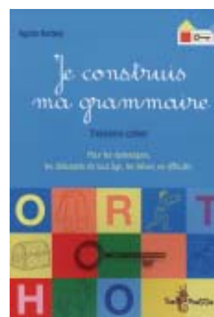
Troisième cahier : CM